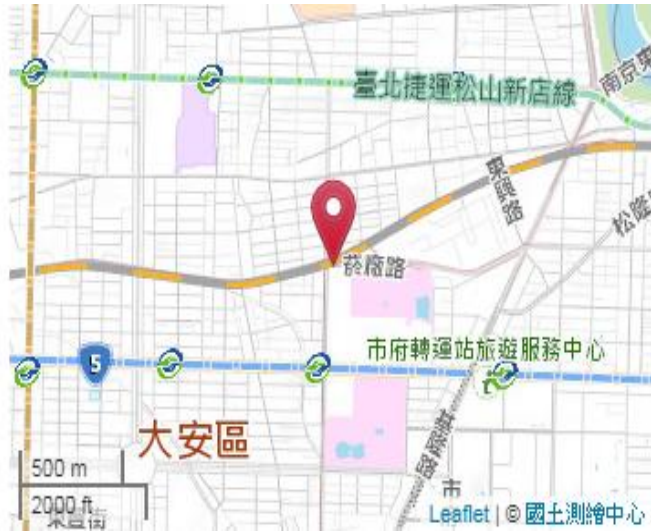
點位略圖(1/25000) 圖名：圖號：