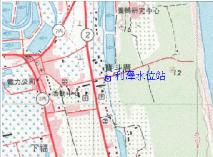
點位略圖(1/25000) 圖名：圖號：