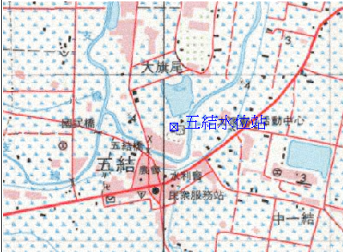
點位略圖(1/25000) 圖名：圖號：