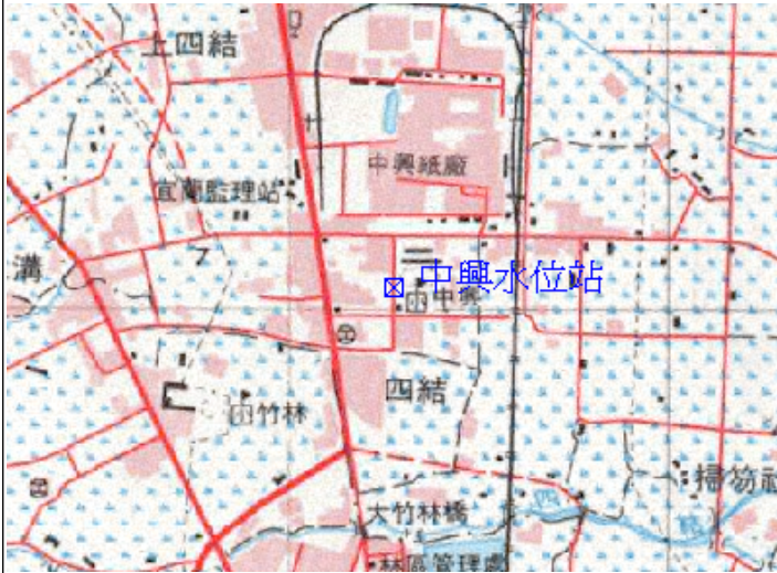
點位略圖(1/25000) 圖名：圖號：