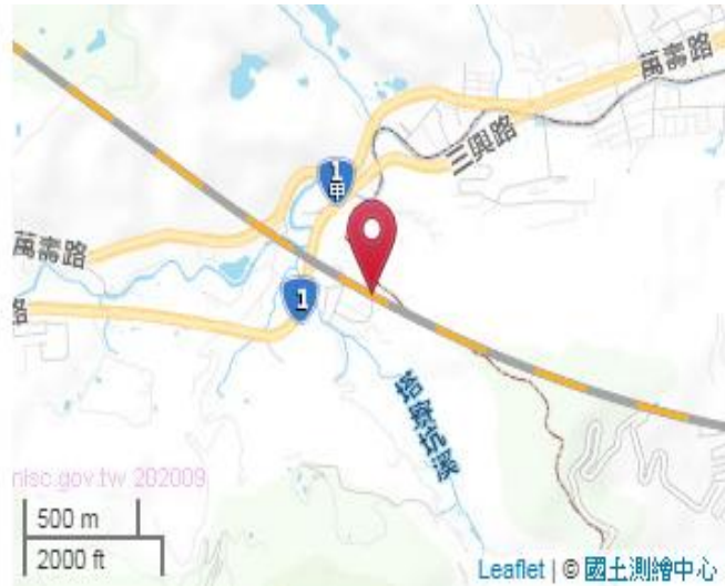
點位略圖(1/25000) 圖名：圖號：