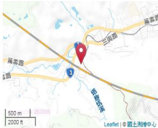
點位略圖(1/25000) 圖名: 圖號: