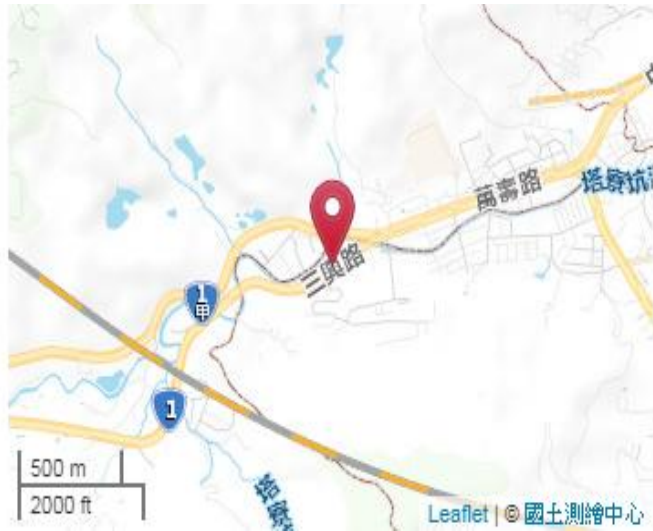
點位略圖(1/25000) 圖名：圖號：