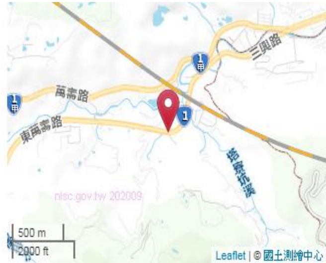
點位略圖(1/25000) 圖名：圖號：