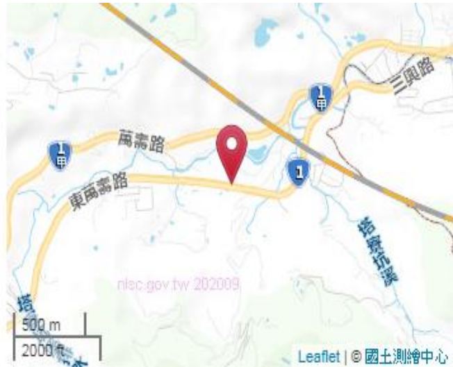
點位略圖(1/25000) 圖名：圖號：