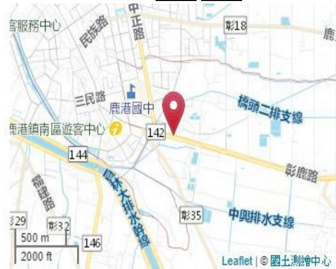
點位略圖(1/25000) 圖名: 圖號: