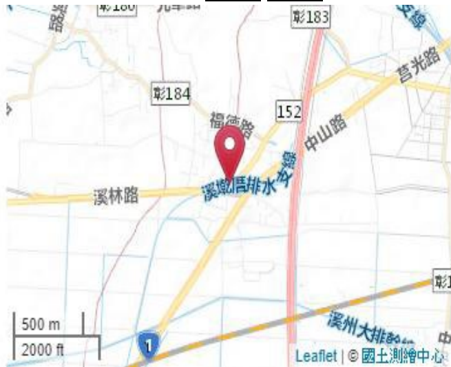
點位略圖(1/25000) 圖名: 圖號: