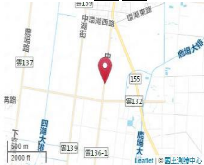
點位略圖(1/25000) 圖名: 圖號: