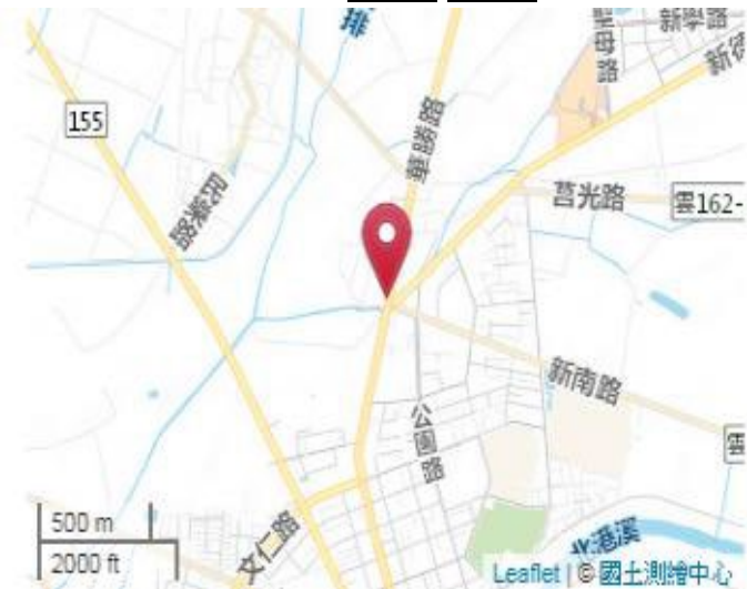
點位略圖(1/25000) 圖名: 圖號: