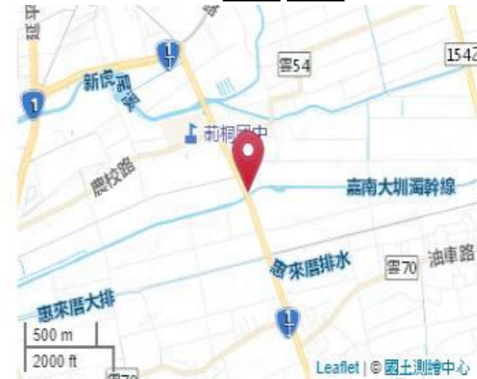
點位略圖(1/25000) 圖名: 圖號: