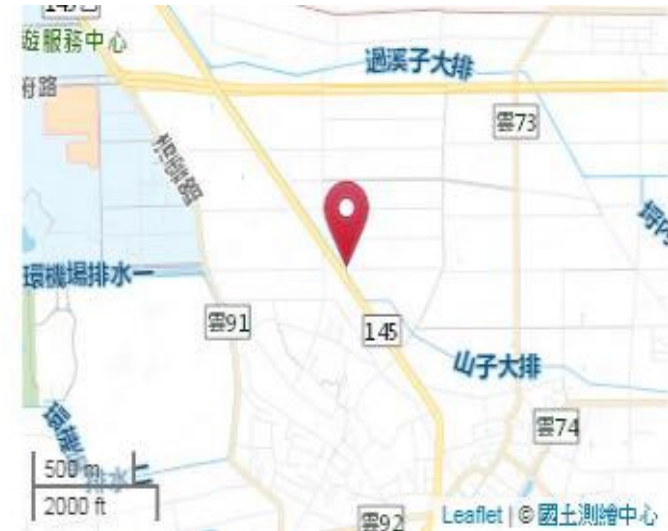
點位略圖(1/25000) 圖名: 圖號: