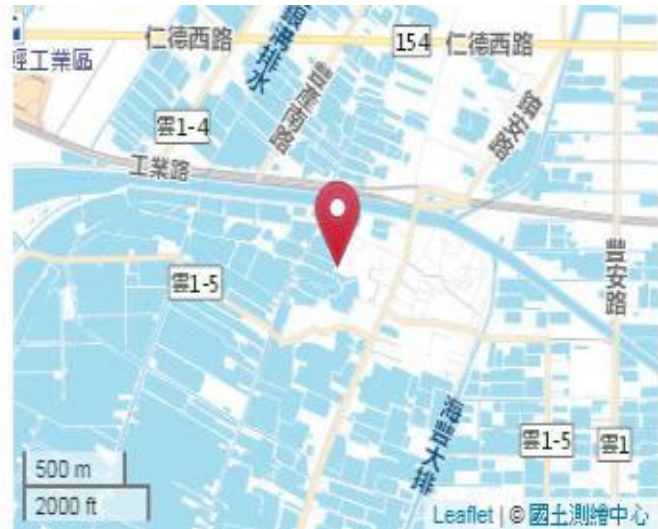
點位略圖(1/25000) 圖名: 圖號: