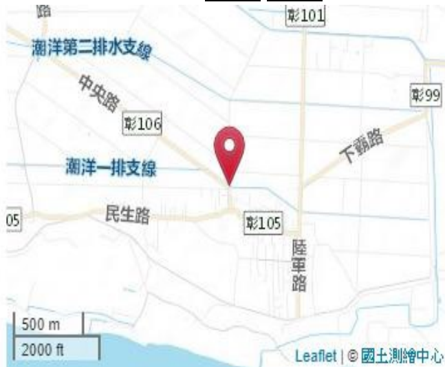
點位略圖(1/25000) 圖名: 圖號: