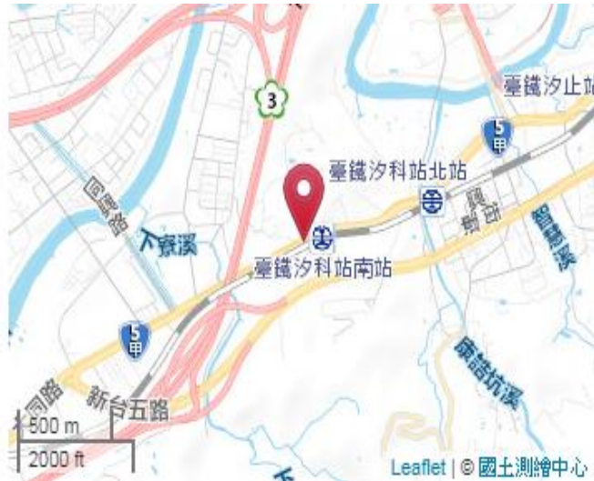
點位略圖(1/25000) 圖名：圖號：