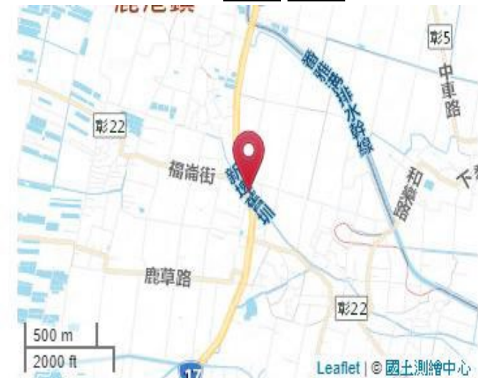
點位略圖(1/25000) 圖名: 圖號: