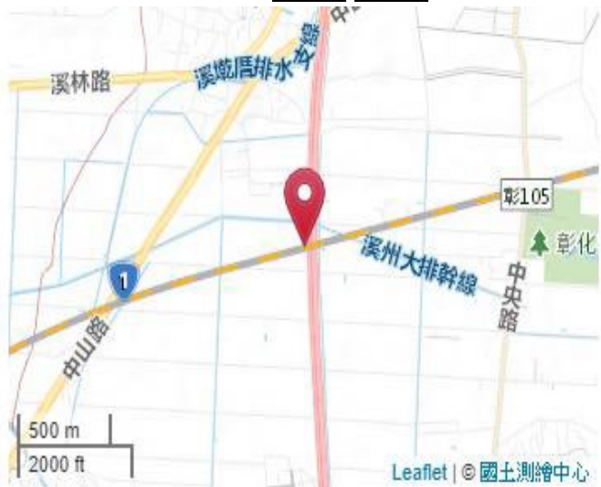
點位略圖(1/25000) 圖名: 圖號: