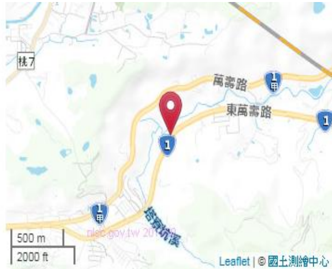
點位略圖(1/25000) 圖名：圖號：