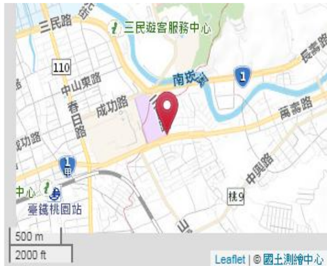
點位略圖(1/25000) 圖名：圖號：