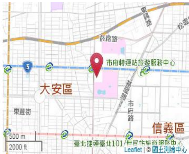
點位略圖(1/25000) 圖名：圖號：