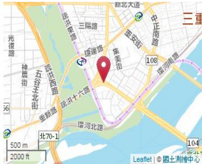
點位略圖(1/25000) 圖名：圖號：