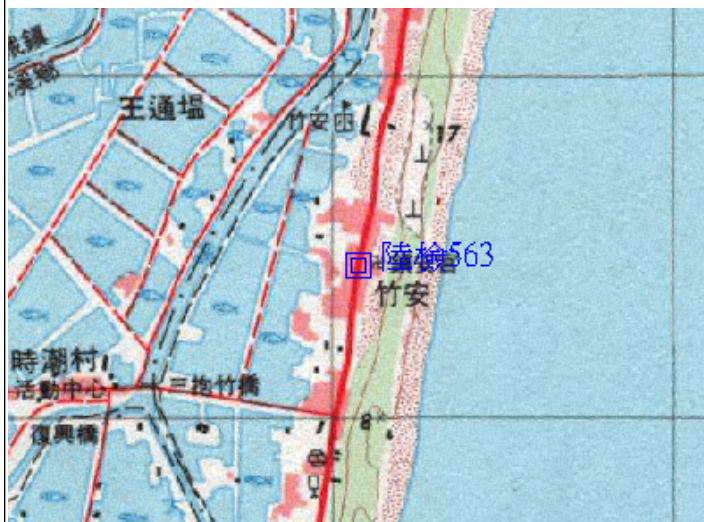
點位略圖(1/25000) 圖名：圖號：