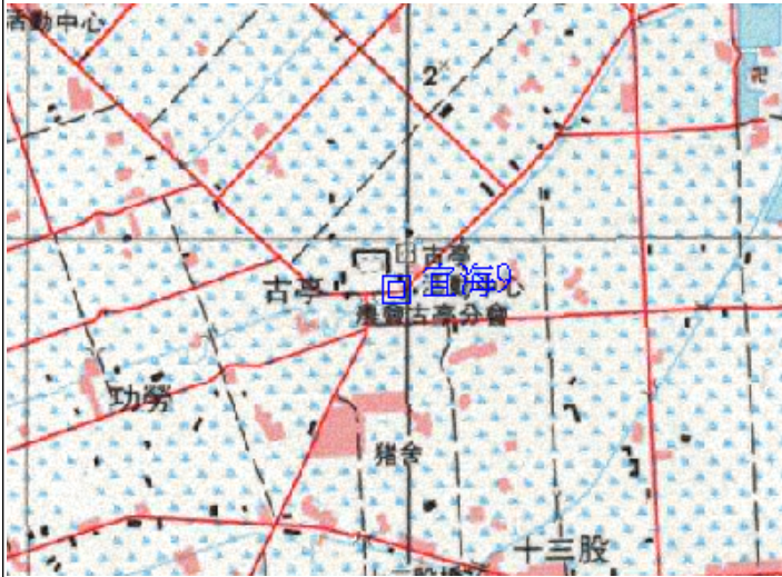
點位略圖(1/25000) 圖名：圖號：