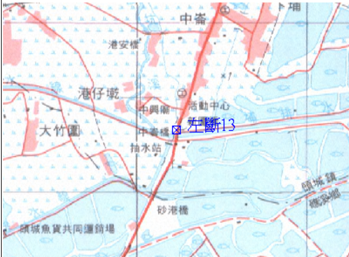
點位略圖(1/25000) 圖名：圖號：