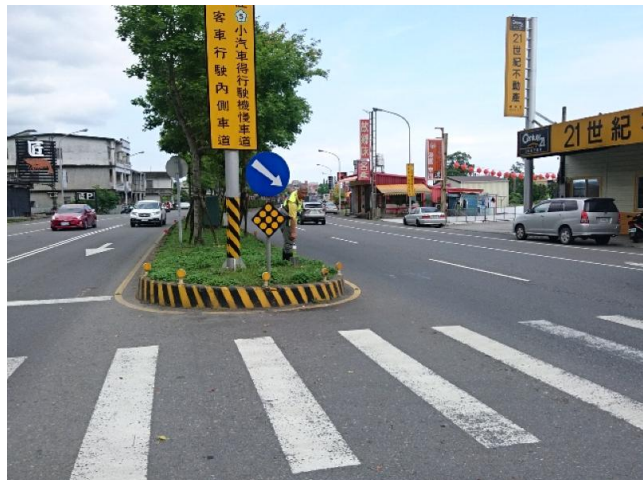
點位說明：台 9 線礁溪路六段 133 巷口