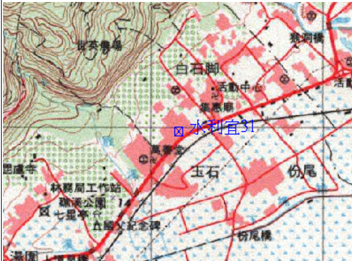
點位略圖(1/25000) 圖名：圖號：