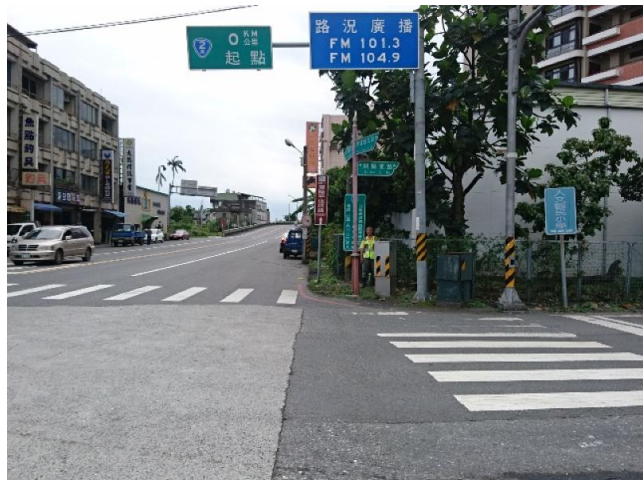
點位說明：台 2 線與台 2 庚線路口