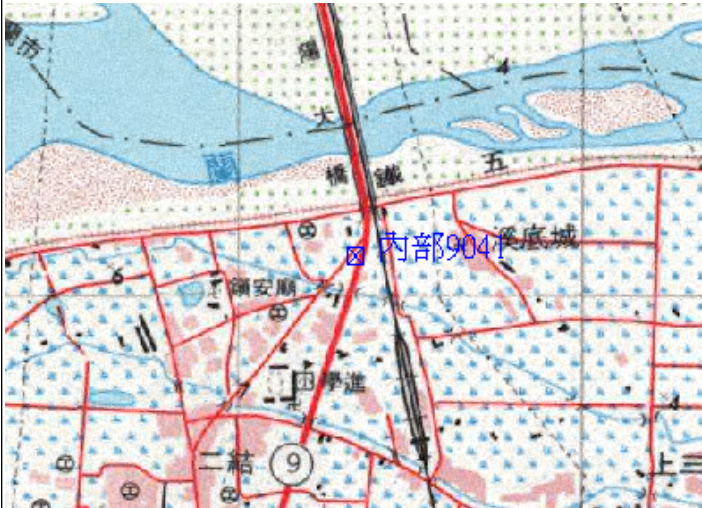
點位略圖(1/25000) 圖名：圖號：