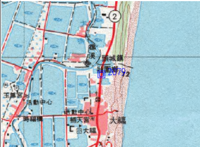
點位略圖(1/25000) 圖名: 圖號: