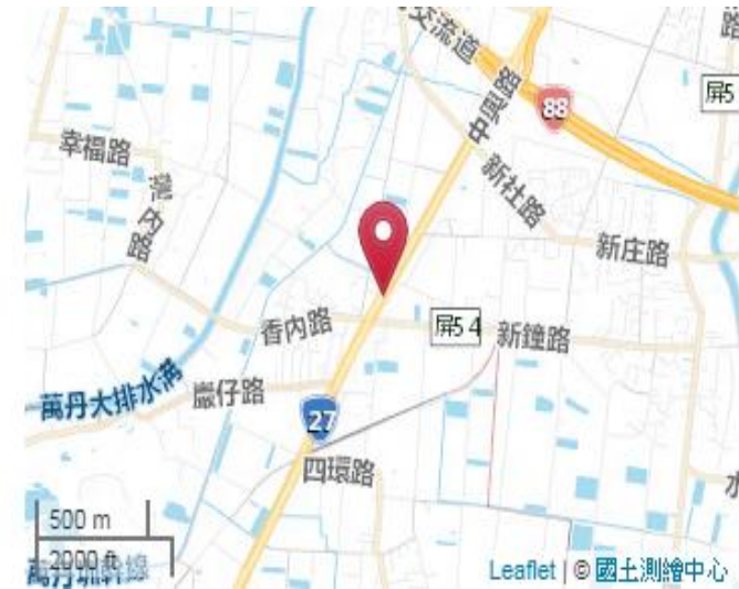
點位略圖(1/25000) 圖名: 圖號: