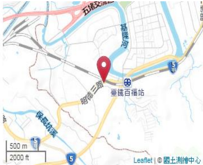
點位略圖(1/25000) 圖名：圖號：