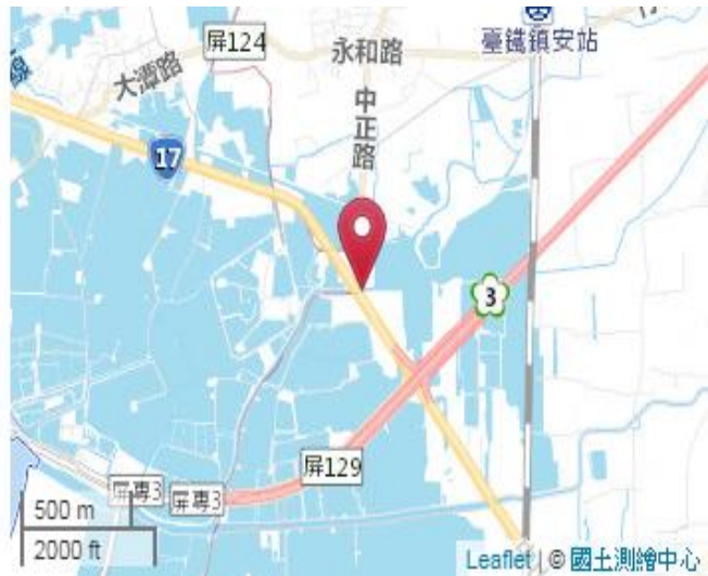
點位略圖(1/25000) 圖名: 圖號: