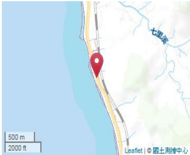
點位略圖(1/25000) 圖名: 圖號: