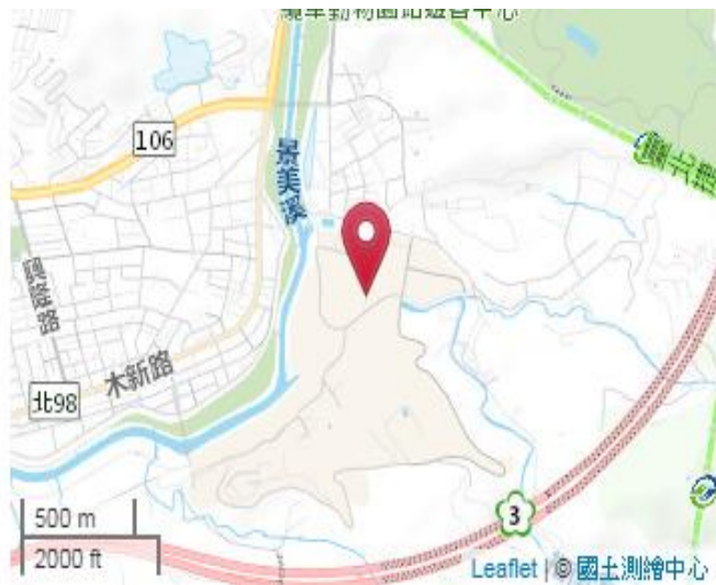
點位略圖(1/25000) 圖名: 圖號: