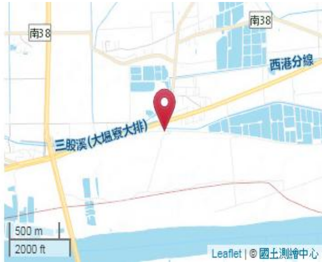
點位略圖(1/25000) 圖名: 圖號: