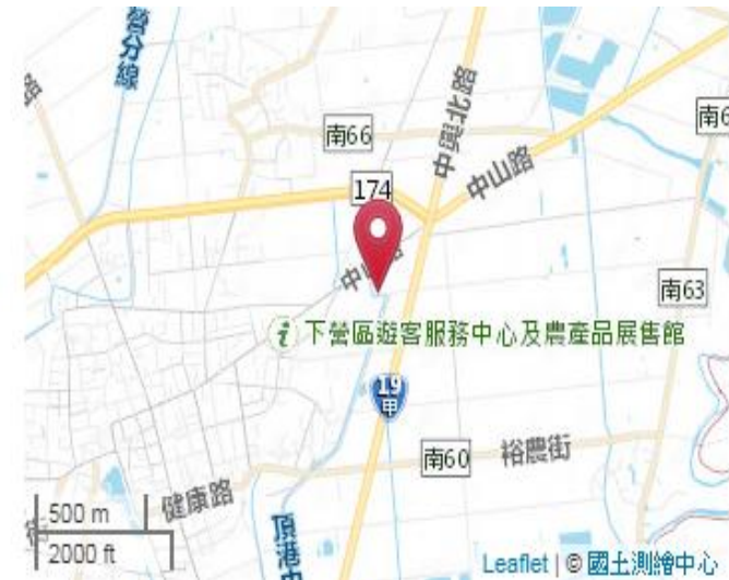
點位略圖(1/25000) 圖名: 圖號: