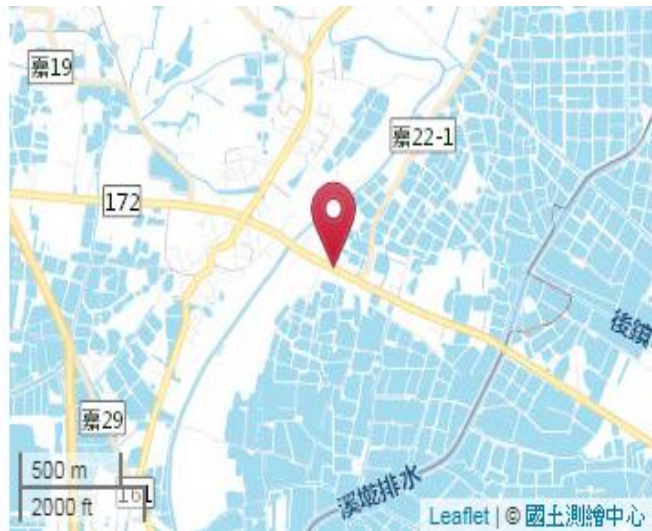
點位略圖(1/25000) 圖名: 圖號: