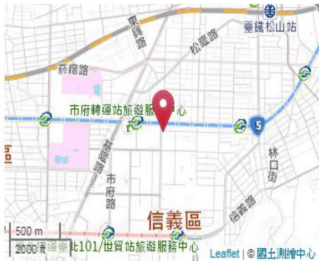
點位略圖(1/25000) 圖名：圖號：