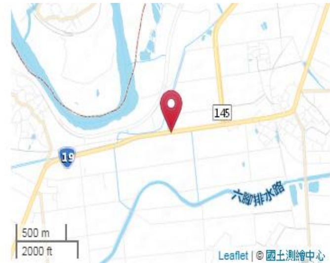
點位略圖(1/25000) 圖名: 圖號: